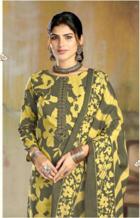
Shades of light green and dark green in a floral print in a kurta and matching shawl with a border of contrasting colors.